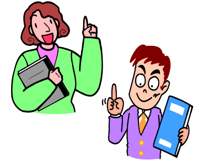
学校・教職員の願い