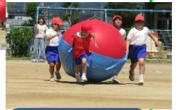
みんなで ゴーゴーゴー!