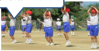
迫力! 協力! 全力!