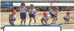
あいうえだんすいんぐ!

晴天の下、93人の児童の全力で頑張る姿が光る発表会でした。今年は、全校での応援歌からスタートしました。どの学年も、練習の成果を発揮しました。保護者の皆様、地域の皆様、応援ありがとうございました。