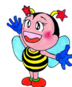
倉敷教育センターマスコット 「サミー (SAMY)」