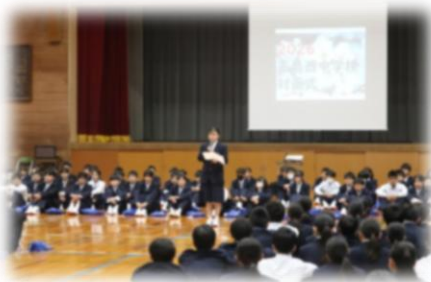
対面式 新入生代表あいさつ

今年度初めて、全校生徒が体育館に集い、在校生代表と新入生代表のあいさつに続いて、先輩たちが工夫を凝らして委員会や部活動の紹介をしました。 ※委員会・部活動の発表の様子は一部です。ご了承ください。