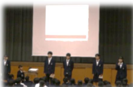
学級委員会の紹介