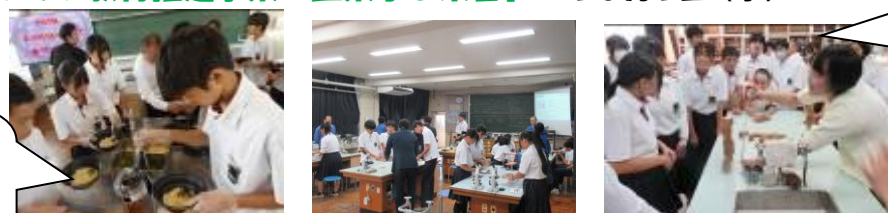
株式会社 ふるいち