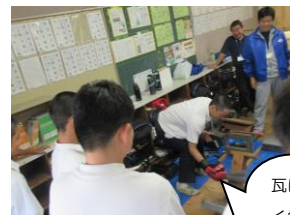
岡山県瓦工事協同組合

実際に働いている人のやりがいや大変なことが聞けて、とても興味が持てた。久しぶりに誕生日会や歌うことができ、懐かしくて楽しかった。保育士の仕事にひかれた。