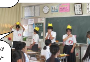
八万認定こども園