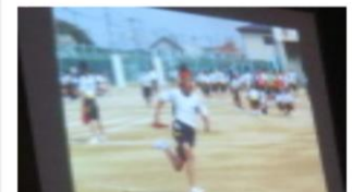
決意ムービーの一場面

江戸時代、14歳になった春、元服という儀式がありました。今でいう「成人式」「20歳を祝う会」にあたります。「元」とは冠をかぶる「服」とは成人の服を着るということです。髪型を変える、名前を改めることも行われ、大人になったということを示しました。そして、自分の行動に責任をもちなさいということをお教えしました。その名残から、現在でも14歳を一つの区切りとして、大人への第一歩を踏み出すための志を立て、立志式を行う学校も多くあります。