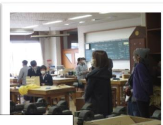
1年参観日 技術 木材を使って製作中です

保護者の方の参観は15分間でしたが、日頃から一生懸命授業に取り組んでいる皆さんの様子がわかり、安心していただいたと思います。クラスのみんなでよい雰囲気を作り、安心した生活を送るようにしましょう。