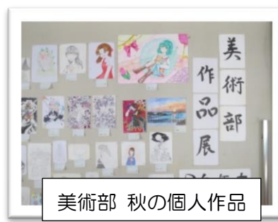
美術部 秋の個人作品

3年生家庭科の授業では、地域子育て支援センターとの協同学習を行いました。自分たちが授業中作ったおもちゃ遊び、絵本の読み聞かせ、手遊び歌などを通して、子供への接し方や気持ちについて学びました。今回はコロナウイルス感染症対策のため、WEBでの授業でしたが、実際に子供たちに会って接したかったですね。弟や妹、いとこなど身近にいれば学んだことを実践してみましよう。将来父母になった時にも思い出してほしいですね。