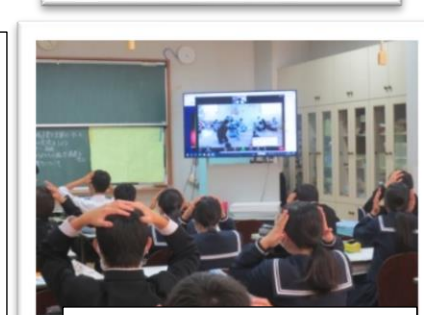
カメラ越しに幼児と対面

3年生家庭科の授業では、地域子育て支援センターとの協同学習を行いました。自分たちが授業中作ったおもちゃ遊び、絵本の読み聞かせ、手遊び歌などを通して、子供への接し方や気持ちについて学びました。今回はコロナウイルス感染症対策のため、WEBでの授業でしたが、実際に子供たちに会って接したかったですね。弟や妹、いとこなど身近にいれば学んだことを実践してみましよう。将来父母になった時にも思い出してほしいですね。