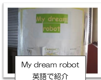
My dream robot 英語で紹介