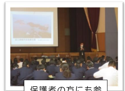
保護者の方にも参加いただきました

この会では、代表の人が司会や開会の言葉、お礼の言葉の役割を果たしました。どの学年も様々な行事や授業の発表会などを通して、役割を果たそうとしています。 自分の力で企画・運営できる人、自分で学ぼうとする人が、今社会で求められています。 これらの素晴らしい取り組みを授業や行事を通じてさらに伸ばしましょう。