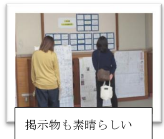
掲示物も素晴らしい

3年生は進路決定に向けての説明会を行いました。3年目となる私立高校のWeb出願、県立高校の説明などを聞きました。17(木)18(金)に行う懇談では、この進路説明会で聞いたことや今までのテストの結果をもとに、進路決定をします。ご家庭での話し合いをよろしくお願ひします。