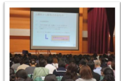
親子で説明を真剣に聞きました