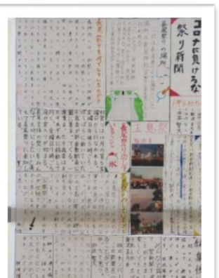
1年総合学習 玉島調べ 11月の玉島ウォークに 向けて、玉島の再発見

1年生では、人権学習の一環として、人が喜ぶ言葉や行動の掲示をしています。また GoodBehavior カードの取り組みでは、1年団の先生方を中心に皆さんの素晴らしい行動を見つけています。普段使っている言葉も、ふわふわ言葉やチクチク言葉など、時には人を喜ばせ、時には人を傷つけることがあります。素晴らしい行動は、人を心地よくします。校訓「敬愛」を大切にしようとする気持ちがうれしいです。