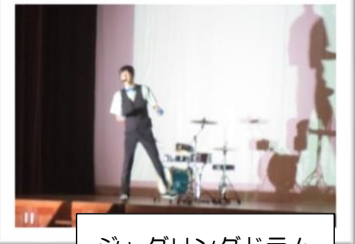
ジャグリングドラム

芸術の秋 今年もコロナウイルス感染症対策のため、2部に分かれて芸術鑑賞を行いました。歌、語り、声まね、ジャグリング、ドラム、落語、パントマイムなど、様々なパフォーマンスを見て「すごい！」と思うものが多くありました。最近では、YouTubeなどで簡単に見ることはできますが、実際に見ることで画面越しでは感じることはできない感動がありました。