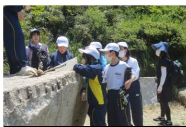
ポイントラリー 大坂城残石群 で家紋を見つけました