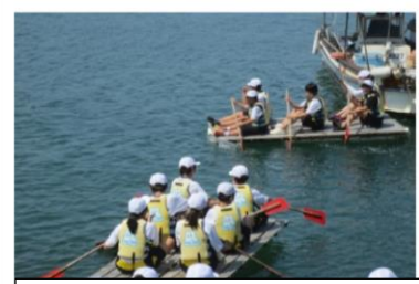
いかだ 力を合わせ漕ぎまし た。水も気持ちよかったです。

3年4組が校長室の掃除をしています。教室から素早く移動し、静かに掃除をしています。短い時間ですが、能率よく取り組んでいます。入退室時「失礼します」終了時「ありがとうございました」のあいさつ、いつも一番に来て掃除をする、退室時向き直ってきちんと礼をするなど、素晴らしい行動が見られます。「さすが3年生」です。礼儀をわきまえた行動や何事も率先して行う姿に感心します。後輩の見本になる先輩です。ありがとうございます。このような行動が玉島北中学校をよくしていると感じます。