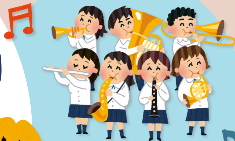
玉島東中学校 吹奏楽部