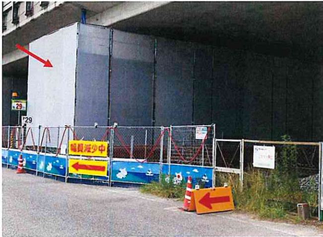
足場落下防止 シート張