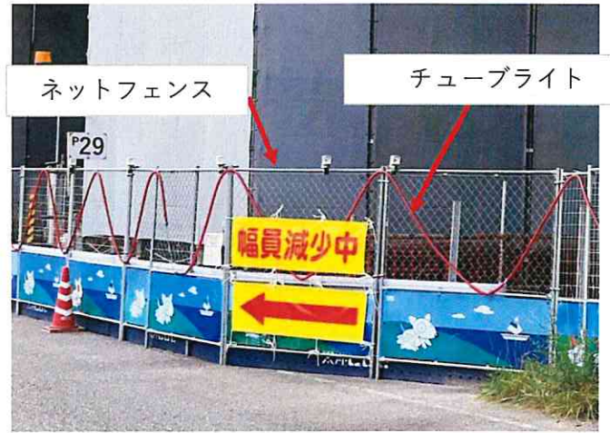
工事範囲明示 (ネットフェンス、夜間点滅チューブライト)