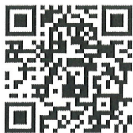
おかやま県立高校情報ナビ

※ 学校の住所、設置されている科、部活動などの基本情報は、「各高校のHP」「おかやま県立高校情報ナビ」「岡山県私学協会」などで調べてみよう。