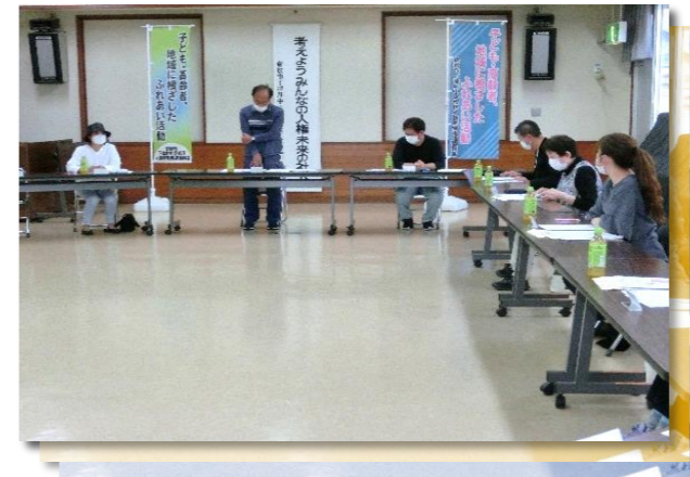
◆役員・事務局会の様子◆

5月19日(木)に役員・事務局会を開催し、令和3年度の報告ならびに令和4年度の事業計画・予算案等の審議を行いました。5月26日(木)に下津井公民館を会場として、人権学習推進委員会総会を開催しました。総会には推進委員の他に、倉敷市教育委員会・市民学習センターの担当者も出席し、昨年度の事業報告・決算報告・本年度の役員案・事業計画案・予算審議が行われ、令和4年度の人権学習推進事業がスタートしました。