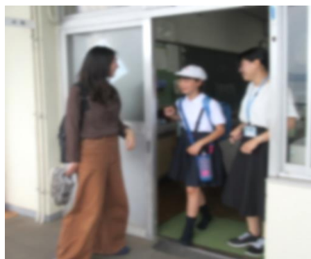
教室の入口で引き渡しの確認をしているところ

保護者の方のご理解とご協力をいただき、無事引き渡し訓練を終えることができました。