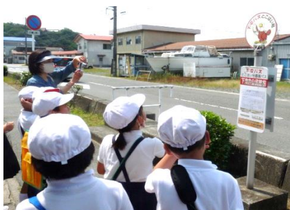
ここはい号のバス停にて

6月13日(火)、2年生が生活科の学習で、町探検に出かけました。探検を通して、町にはみんなが使うものがあることやそれを支えている人々がいることなどについて考えることができました。