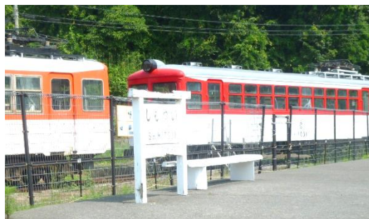
旧下津井駅(下津井電鉄)