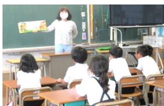
読み聞かせの様子