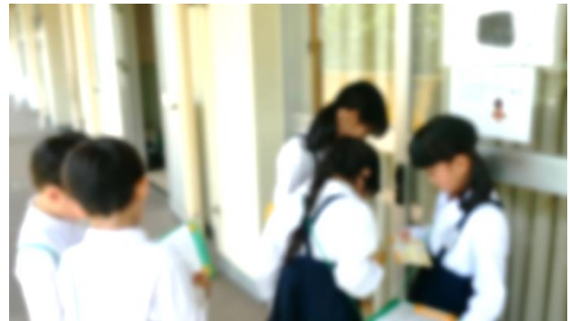
優しく1年生のお世話をする2年生