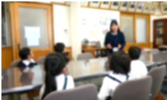
校長室でお話をしっかりと聞いている様子