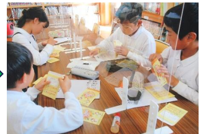
種を袋に入れてメッセージを書いています