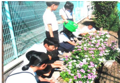
花のお世話をしています