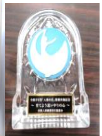
岡山地方法務局倉敷支局長さん、人権擁護委員の方より 感謝状をいただきました