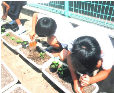
苗をプランターに植え替えています

子どもたち一人一人の中に、やさしい心が育ったように思います。これからもそのやさしい心と思いやりの心で、友達や家族を大切にしていけることができるようにと願っています。