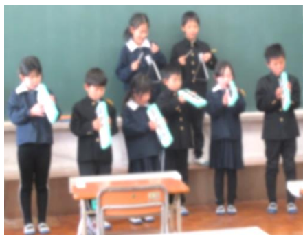
1年生による音楽発表