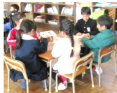
パッチンガエルづくり