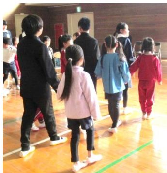
5年生といっしょに