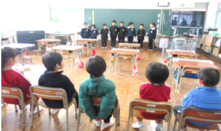
1年生による お迎えのあいさつ

1月30日、4月に入学してくる新1年生の一日入学がありました。1年生の教室では、いっしょにパッチンガエルを作って遊んだり、鍵盤ハーモニカの演奏を聞いたりしました。今の1年生は、とてもはりきって、新1年生のお世話ができていました。4月が楽しみです。