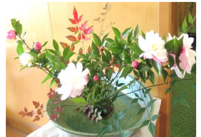
事務の先生が生けてくださった裏庭の花