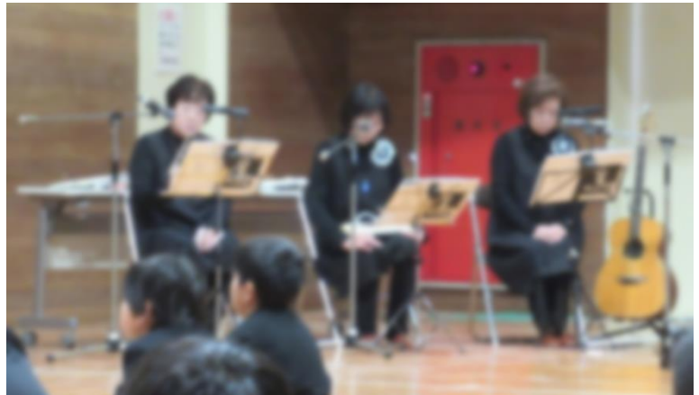
心に響く演奏とお話に、引き込まれている子どもたちの様子