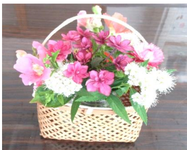
事務の先生が裏庭の花をいつもすてきにかざってくださいます♥