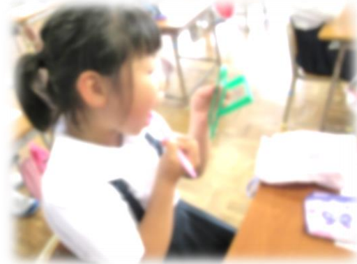
かがみを見ながら、みがき残しをチェック!