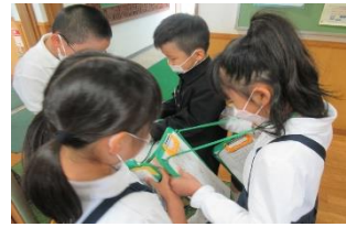
2年生が1年生のお世話をしている様子