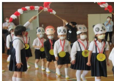
各学年からのプレゼント