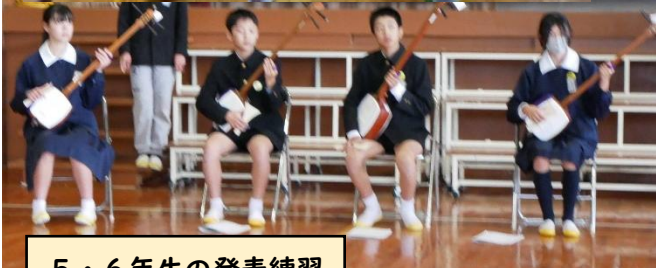
5・6年生の発表練習