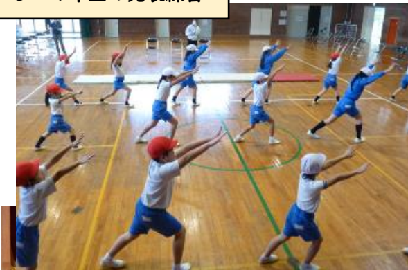
3・4年生の発表練習