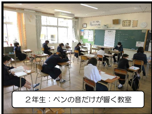
2年生：ペンの音だけが響く教室