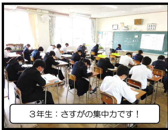
3年生：さすがの集中力です！