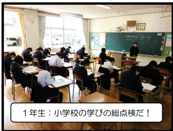
1年生：小学校の学びの総点検だ！

ちなみに正解は、 ぐんしゅう、おんだん、 たんきゅう、つとめ、才能、 たのみ、敬う、ところ、半径、 速やか、納めた、牛乳 でした。 さて、全部解けましたか？