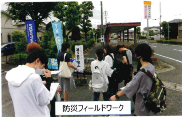
防災フィールドワーク