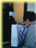
チャリティーバザー