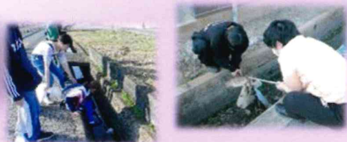
春季清掃ボランティア