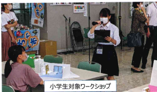
小学生対象ワークショップ