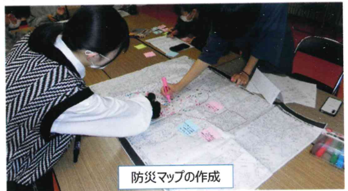
防災マップの作成