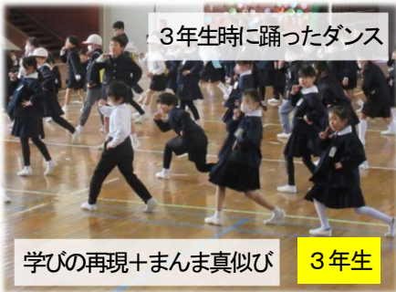
3年生時に踊ったダンス