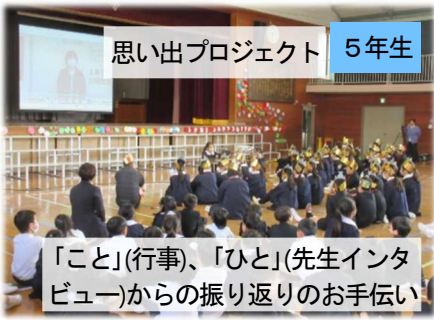
思い出プロジェクト

芸術や文学に「オマージュ」という言葉があります。「尊敬する作家に影響を受け、似た作品を創作すること」とされていますが、1～4年生児童による「まんま真似ぶ」姿は、「6年生に対する最高の尊敬の姿」に外なりません。