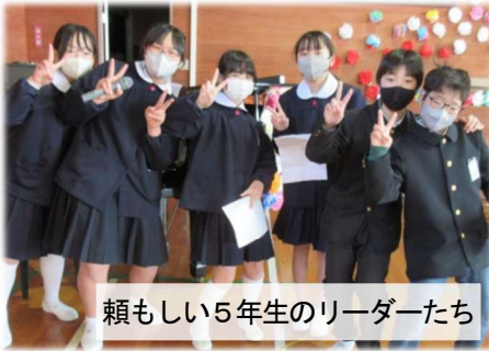
頼もしい5年生のリーダーたち

3月8日(金)に、6年生を送る会が開かれました。「すごい」には、「ぞっとするほど恐ろしい」というニュアンスがあり、筆者はこれまで使用を避けてきましたが、5年生をはじめ、全校児童の思いが結集した「すごい」会でした。