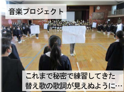
音楽プロジェクト

5年生からのお礼は、本校が委員会等でも実践してきたPBL (Project Based Learning) によるものでした。