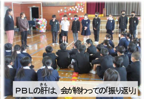
きも PBLの肝は、会が終わっての「振り返り」