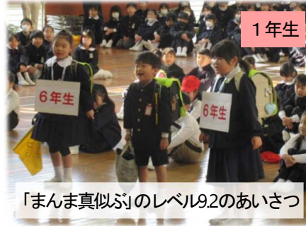
「まんま真似ぶ」のレベル9.2のあいさつ