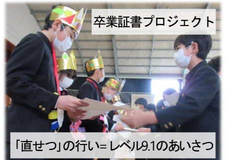
卒業証書プロジェクト