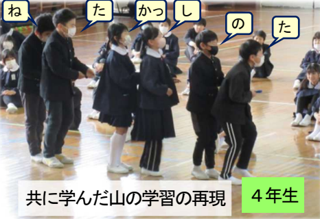
共に学んだ山の学習の再現