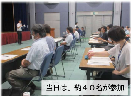
当日は、約40名が参加

さる8月3日(木)、市の生涯学習課から、本校の協働本部の取組を他校の先生方に紹介させていただく機会をいただきました。コーディネーターからは「乙島愛」を語っていただき、本校の取組も高い評価をいただきました。