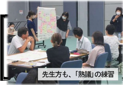
先生方も、「熟議」の練習