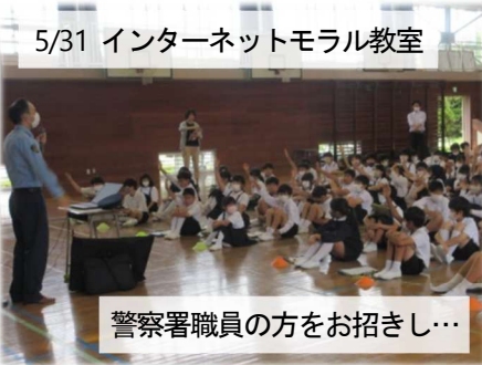
5/31 インターネットモラル教室

ネットモラルについては、「人権侵害」を招く懸念から、5月末日、全校児童を対象に、発達段階に応じた指導を行いました。趣旨は、「ひと」を大切にすること…。次に、6月の校内人権週間の取組結果をご報告します。