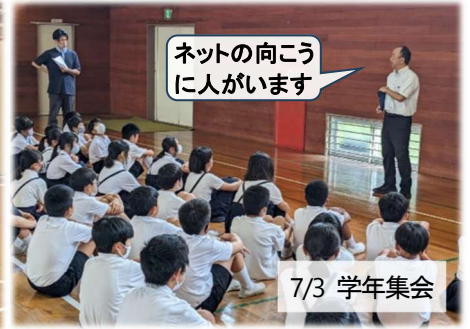
ネットの向こうに人がいます