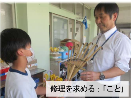
修理を求める：「こと」