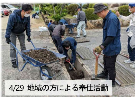
4/29 地域の方による奉仕活動