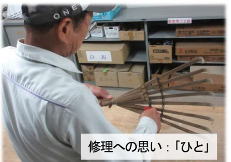
修理への思い：「ひと」

入学式準備・清掃の日、5年生の児童が熊手を修理してほしいと筆者に届けに来ました。針金を求めていると、校務の先生が、早く、「直しておきますよ…」と。修理が終わって届けに行くと、「友達の道具」だったのでした…。