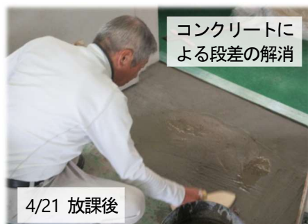
コンクリートによる段差の解消