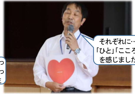
それぞれに…「ひと」「こと」を感じました