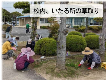
校内、いたる所の草取り