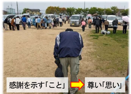
感謝を示す「こと」 → 尊い「思い」