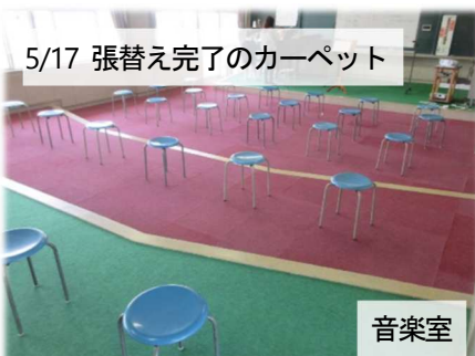
5/17 張替え完了のカーペット