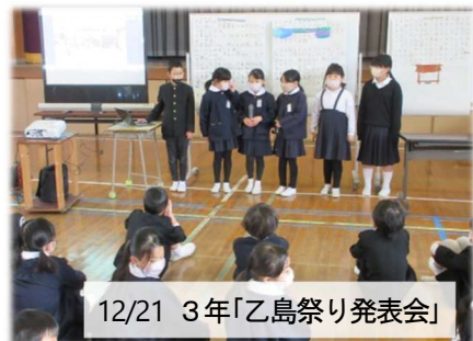
12/21 3年「乙島祭り発表会」