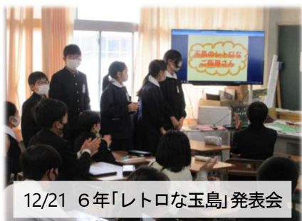
12/21 6年「レトロな玉島」発表会