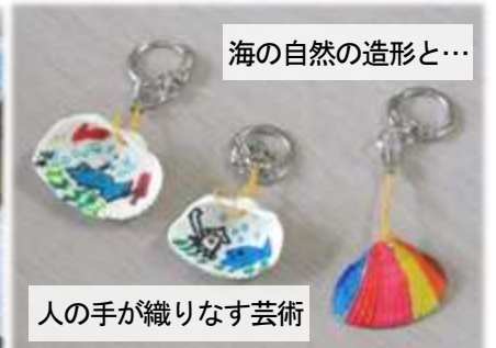
海の自然の造形と…