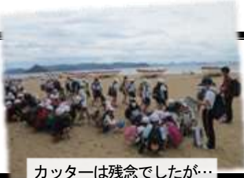
カッターは残念でしたが…