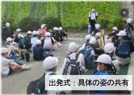
出発式：具体の姿の共有