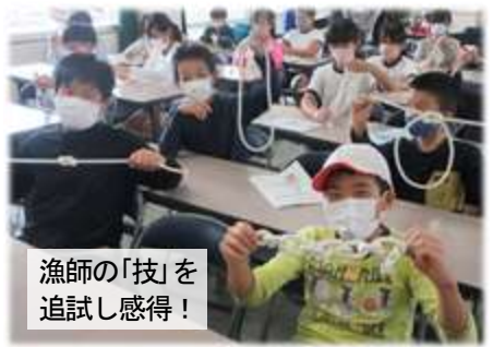
漁師の「技」を 追試し感得！

本校では、これまで繰り返しお伝えしてきた通り、岡山県が進める「夢育(ゆめいく)」が重視する「非認知能力」の育成に取り組んでいます。また、その三つの力である「目標に向かう力」「人と関わる力」「感情をコントロールする力」は、客観的に評価する上で、「具体の姿の想定」が必要です。この概念くだきを「チャンクダウン」といいます。