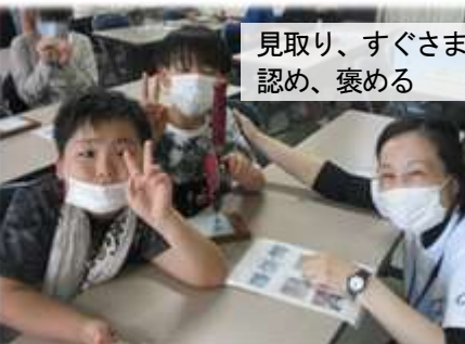
見取り、すぐさま 認め、褒める