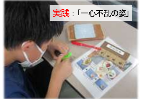
実践：「一心不乱の姿」