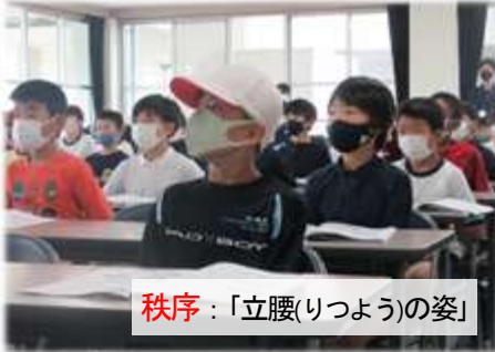
秩序：「立腰(りつよう)の姿」

9月6日（火）に実施された5年生の「海の学習」。台風11号の影響でカッター訓練が中止にはなりましたが、「集団活動を通して、秩序・友情・実践の精神を養う」という「ねらい」は、十分果たして帰ってきました。