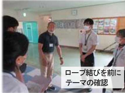
ロープ結びを前に テーマの確認