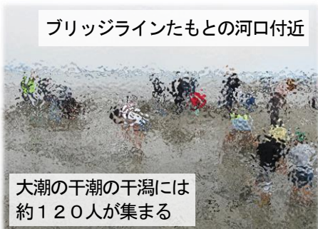
ブリッジラインたもとの河口付近