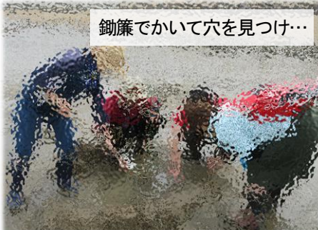
鋤簾でかいて穴を見つけ...