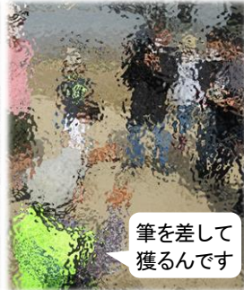
筆を差して 獲るんです