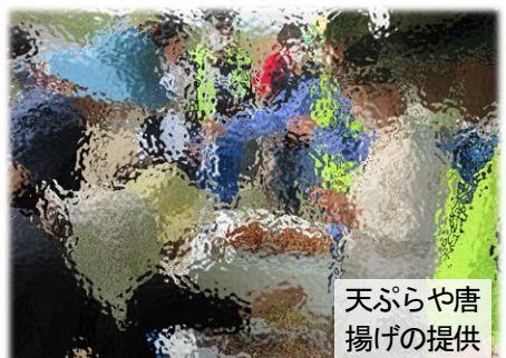
天ぷらや唐揚げの提供