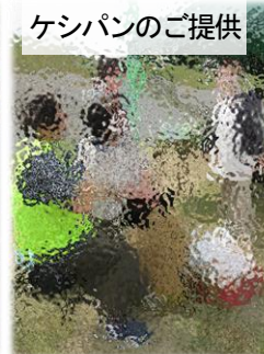
ケシパンのご提供