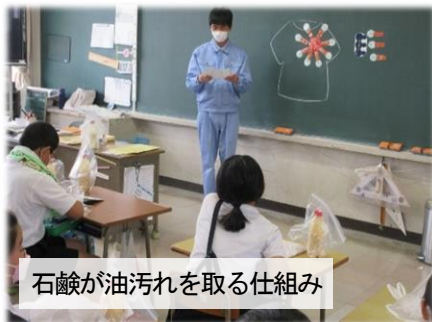
石鹼が油汚れを取る仕組み

同じく、9日（月）の5・6校時には、水島工業高校の生徒さんが本校に来てくださり、「廃油石鹸づくり」の出前授業にお力添えをいただきました。4年生では、これを総合的な学習の時間における単元学習の導入活動として位置付けており、活動を通じた気付きや振り返りから、個々の児童が、まず、「めあて」を設定します。次に、その「めあて」を出し合い、「共通に」追究するものを見だし、「テーマ」を設定するという流れを想定しています。