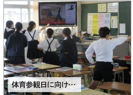
体育参観日に向け…

5月9日（月）の放送朝礼では、4月の始業式のお話でも触れた「テーマ」と「めあて」のそれぞれについて説明しました。本校の四つの「めざす子ども像」は、「めあて」というよりは、むしろ「テーマ」で、それは、「みんな」が「共通に」めざすから…ということで説明しました。では、「めあて」は…？「体育参観日」を例に説明しましょう。