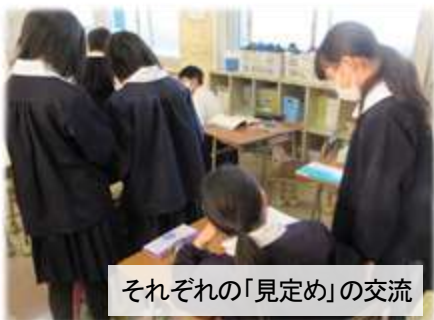
それぞれの「見定め」の交流