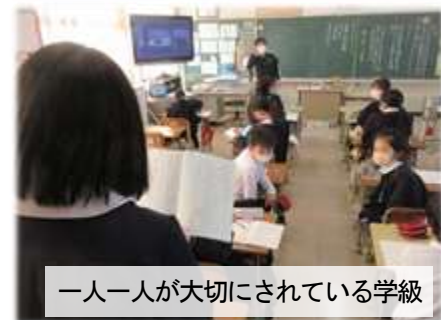
一人一人が大切にされている学級