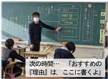
次の時間…「おすすめの『理由』は、ここに書くよ」