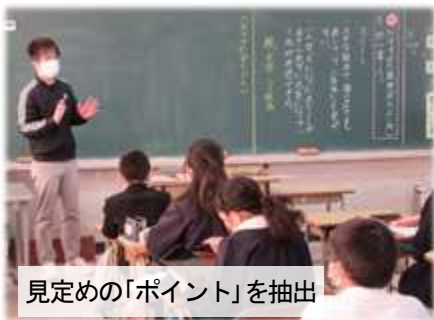
見定め「ポイント」を抽出