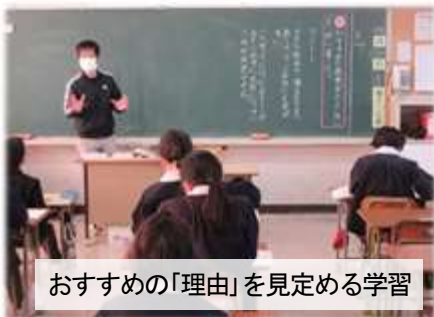
おすすめの「理由」を見定める学習