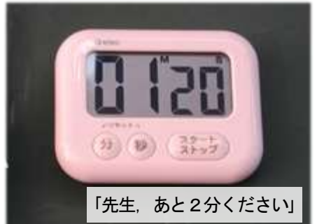
「先生、あと2分ください」