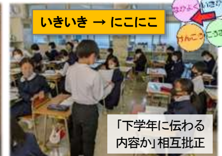
いきいき → にこにこ