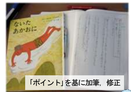
「ポイント」を基に加筆、修正