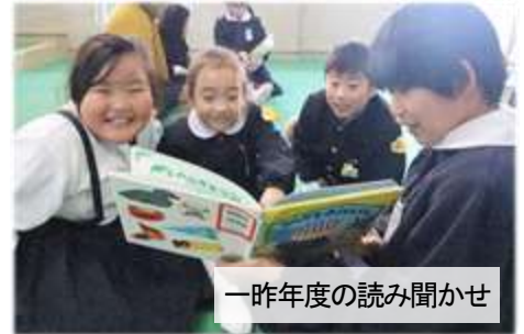
一昨年度の読み聞かせ

しかし、縦割り班である「ピッカピカ班」は、毎日の清掃活動を中心として、高学年の児童が低学年の児童をいたり、低学年の児童は高学年の児童に信頼を寄せるなどして展開されている価値を鑑み、「延期」して実施することとしました。5年ろ組では、その「来たるべき日」に向けて、読み聞かせをする本を推薦する文章を書く学習が展開されていました。