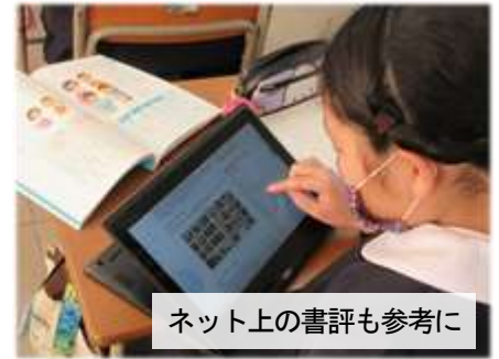
ネット上の書評も参考に