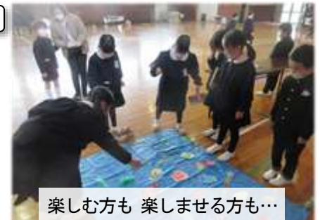
楽しむ方も 楽しませる方も...