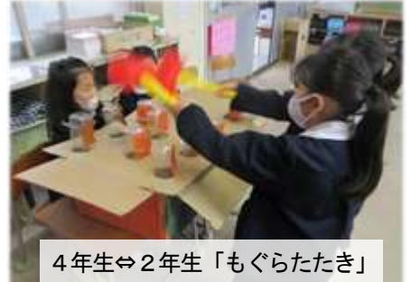
4年生⇔2年生「もぐらたたき」