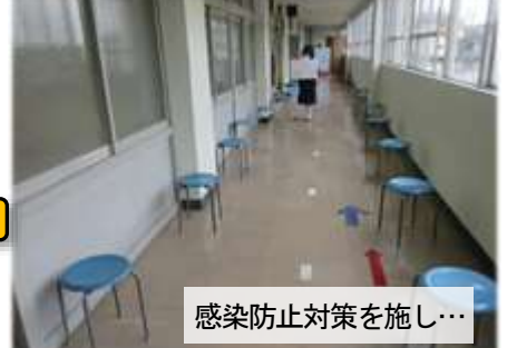
感染防止対策を施し...