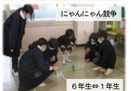
にゃんにゃん競争