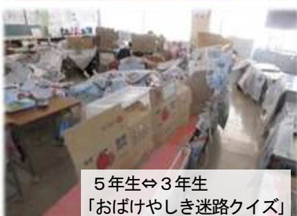
5年生⇔3年生「おぼけやしき迷路クイズ」