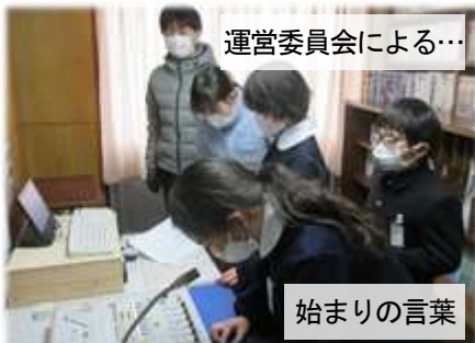
運営委員会による...