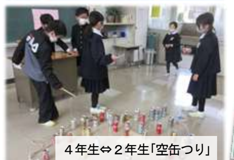
4年生⇔2年生「空缶つり」