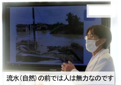
流水(自然)の前では人は無力なのです