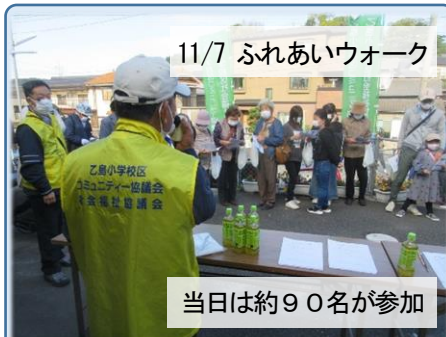
11/7 ふれあいウォーク

「これまでに」地域に生きてきて、「これからも」地域に生きていく方々が集い、生きる喜びを共有しました。