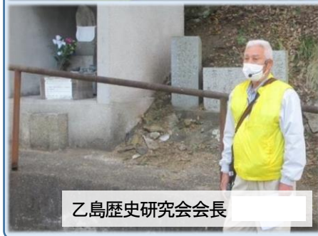
乙島歴史研究会会長