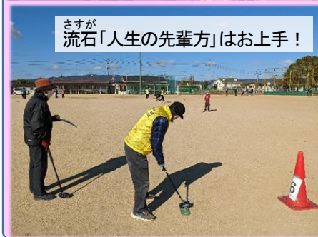
さすが 流石「人生の先輩方」はお上手！