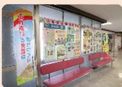
真備公民館（作品展）