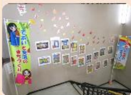
ポスター掲示（階段）

新型コロナウイルス感染拡大防止に配慮しながら、人権学習推進事業がより良いものになりますように、皆様方のご理解とご協力をお願いします。