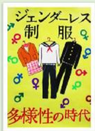
真備中3年 矢暮 愛怜