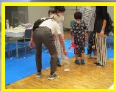
ふれあい工作教室