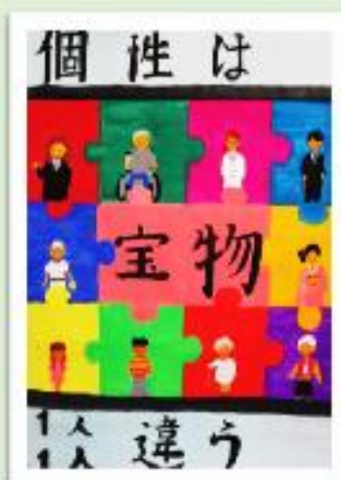
真備中1年 長尾 みなみ