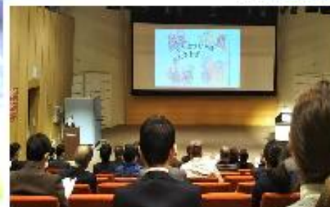
実践報告「どうぶつむらは おおさわぎ」 の取組 ～ 創作紙芝居の実践 ～