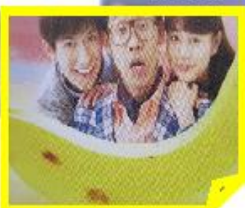
映画 「こんな夜更けにバナナ かよ 愛しき実話」