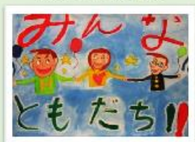
呉妹小4年 長谷川 睦一