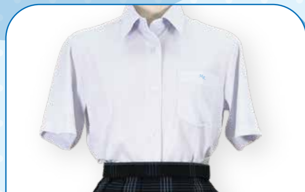
半袖ニットシャツ