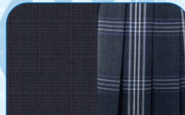
スラックス・スカート