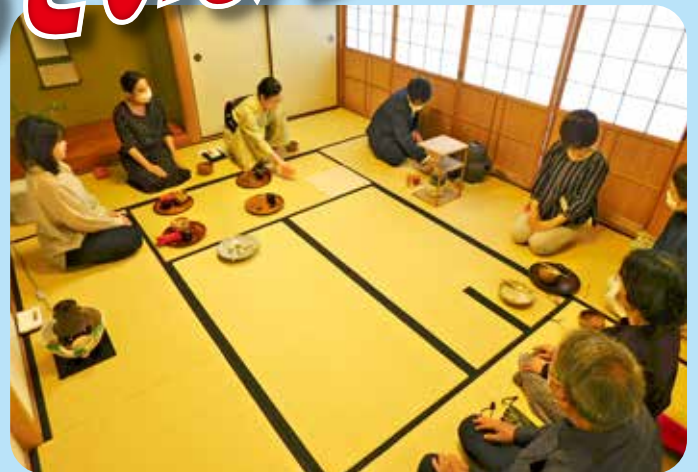
【くらしき市民講座】茶道入門 玉島東公民館