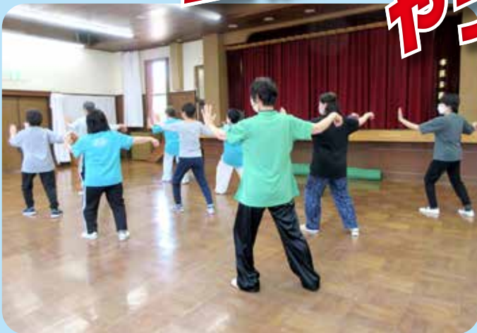
ゆっくりのんびり太極拳 本荘公民館