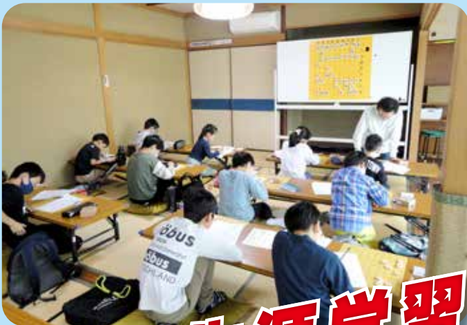
子ども将棋教室 倉敷東公民館

発行 倉敷市生涯学習推進本部 編集 倉敷市教育委員会 ライフパーク倉敷市民学習センター TEL (086)454-0011 FAX (086)454-0305