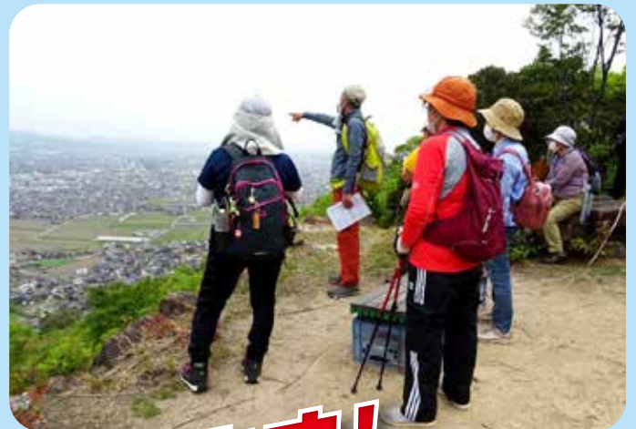
大平山でハイキングを 安全に楽しもう 連島公民館