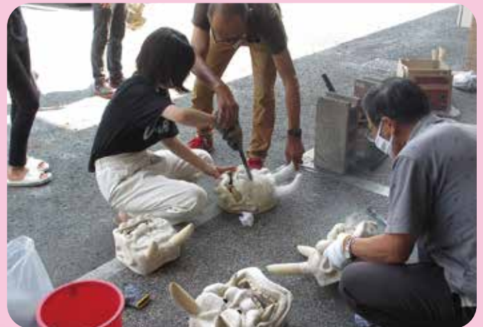
鬼面づくり 茶屋町公民館