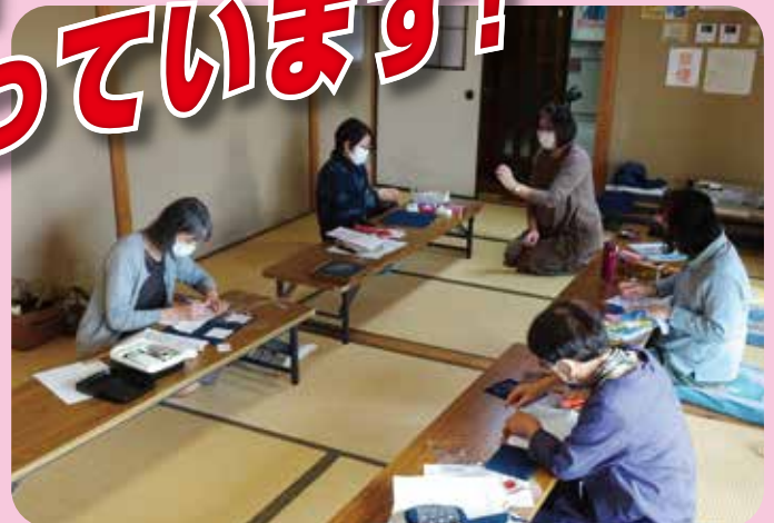
チクチク刺し子 福田公民館