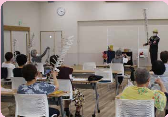
生涯学集—ことうら塾—「マジック」 琴浦公民館

発行 倉敷市生涯学習推進本部 編集 倉敷市教育委員会 ライフパーク倉敷市民学習センター TEL(086)454-0011 FAX(086)454-0305