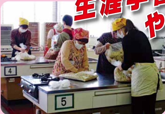
ふるさと船穂味噌作り 船穂公民館