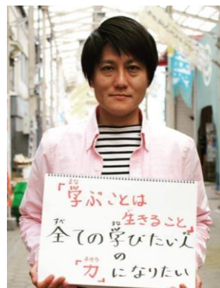
講師のプロフィール

広島県生まれで、現在は、香川県初となる公立夜間中学（三豊市立高瀬中学校夜間学級）で英語教諭として勤務。また、三豊市における夜間中学協議会の委員を務める。2017年4月、岡山県内で学び直しを望む人のために、岡山国際交流センターを教室にして「岡山自主夜間中学校」を立ち上げ、2018年12月には、一般社団法人としての活動をスタート。2022年4月には、「もっと勉強したい」という生徒の要望に応え、岡山市表町に「岡山自主夜間中学校」の常設教室を整備。「誰一人取り残さない教育を求めて」という信念のもと、一般社団法人「岡山に夜間中学校をつくる会」の理事長として、「岡山自主夜間中学校」の運営に携わるとともに、岡山をはじめ全国に「公立夜間中学校」が設置されるよう尽力している。