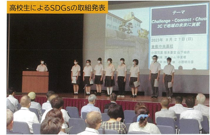
高校生によるSDGsの取組発表

そして、高校生によるSDGsの取組発表では、古城池高校の生徒たちは「子どものhappyであふれる地域へ！」をテーマにフードロス問題に取り組み、2か所の子ども食堂運営に関わりながら自分たちの取組を通じて地域づくりに貢献をしていました。もう一校の中央高校では、「Challenge・Connect・Chuo 3Cで地域の未来に貢献」をテーマに、地域高齢者宅への訪問アンケートを実施して、地域の問題把握から「地域問題」を考えるプロジェクトを立ち上げて