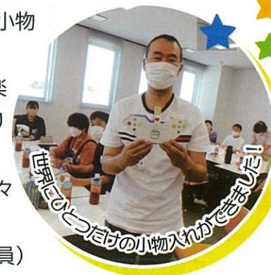
世界に一つだけの小物入れができました!