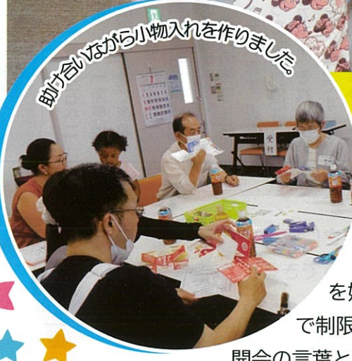
助け合いながら小物入れを作りました。