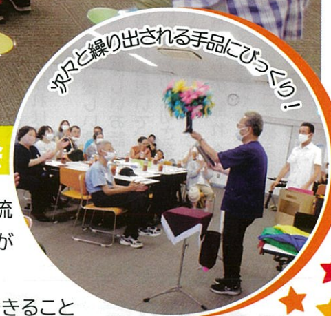
次々と繰り出される手品にびっくり!

また来年も、大樹の皆さんと笑顔でお会いできることを楽しみにしています。(推進委員)