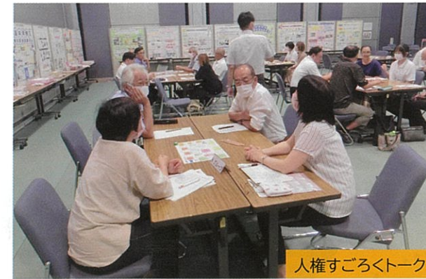
人権すごろくトーク

いました。両校生徒の取組は、若い世代がより地域に関わろうと模索しながら、その活動の中で人権尊重の重要性を学ぶ取組であったと思います。