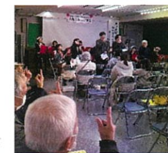
手話で歌う参加者

連島公民館の一階ロビーに人権ポスター・標語、人権啓発マスコットキャラクター「れんちゃん」のぬり絵を展示しました。のぞみ保育園・連島こども園・連島東保育園・連島幼稚園の年長さん65名のぬり絵が集まりました。