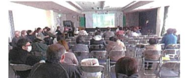
映画に見入る参加者

② 「子どもシアター」では、日本の冬休みの行事をテーマにした映画が上映されました。お正月の準備や地域の行事を描いた映像に、会場からは懐かしさと共感の声が聞こえてきました。