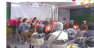
クリスマスソングを楽しむ会場

③ 「ふれあいコンサート」では、公民館グループ「メリーサウンド」によるクリスマスにちなんだ曲が披露され、会場は一気に華やきました。音楽は国や世代を超えて心をつなぐ力をもっていることに改めて気づかされるひと時でした。