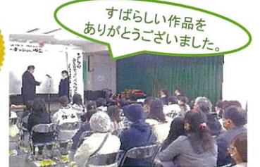
表彰を受ける子どもたち

② 「子どもシアター」では、日本の冬休みの行事をテーマにした映画が上映されました。お正月の準備や地域の行事を描いた映像に、会場からは懐かしさと共感の声が聞こえてきました。