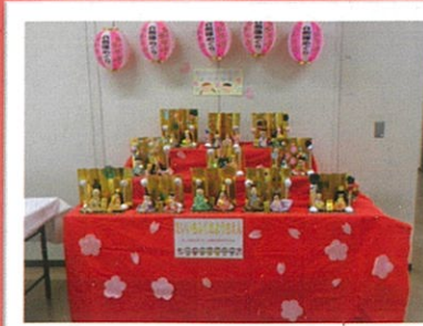
第一福田幼稚園児の手作りひょうたん雛人形（去年の作品）