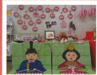
デイサービスの利用者の手作りお雛様（去年の作品）