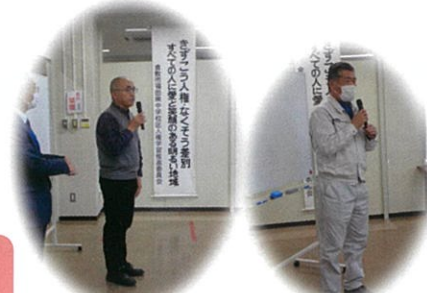
折田会長・大島副会長のあいさつ