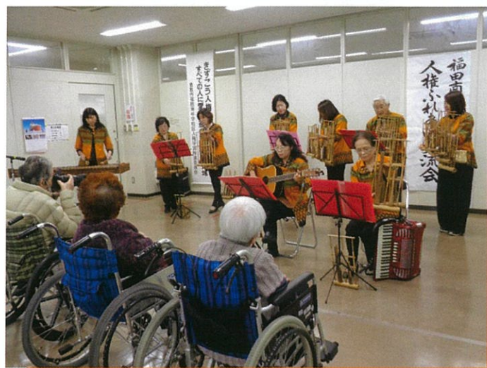
「アングルン会」によるインドネシア民族音楽の演奏