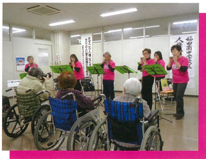
「スイート・P」によるオカリナの演奏