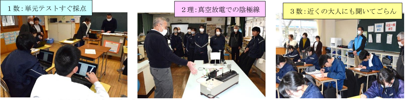
1数: 単元テストすぐ採点