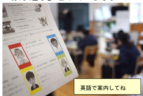
英語で案内してね

1時間の授業の中に「めあて」があり、達成できるよう様々な仕掛けを用意しています。チョーク、ワークシート、話術、タブレットと先生により方法は違います。そしてその1時間で何が出来るようになったか「振り返り」をしています。