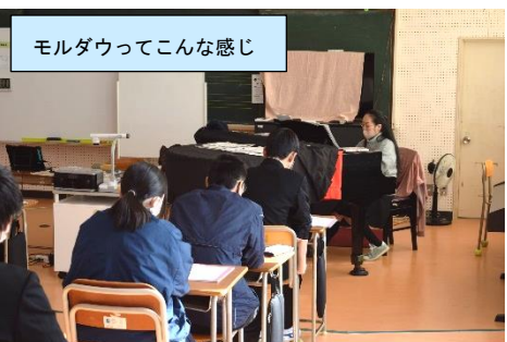
モルダウってこんな感じ