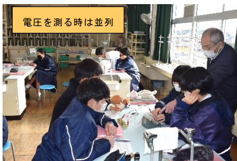
電圧を測る時は並列