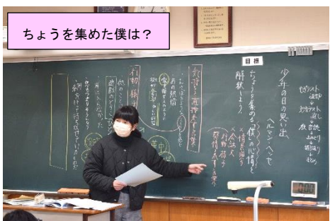
ちょうを集めた僕は?