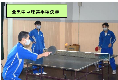
全黒中卓球選手権決勝