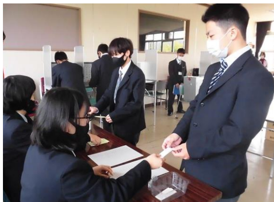
本格的に模擬選挙を体験しました！！