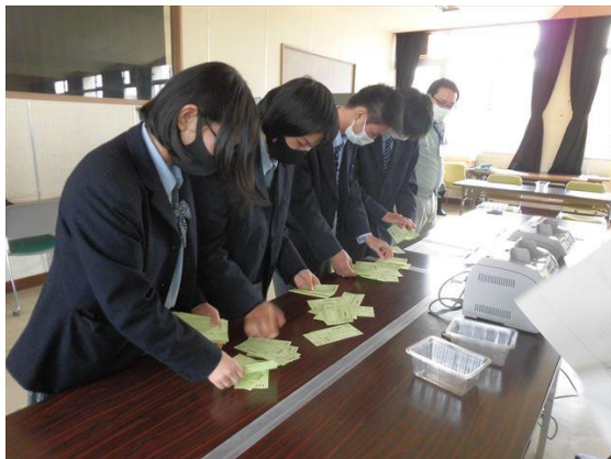
開票作業も体験しました！