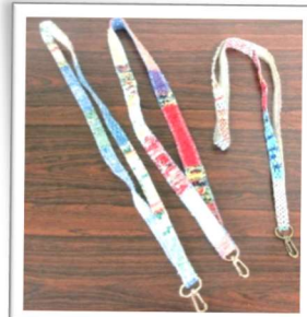
ネームストラップ