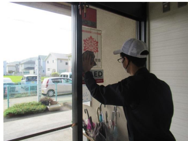
【クリーン班（新田公民館）】