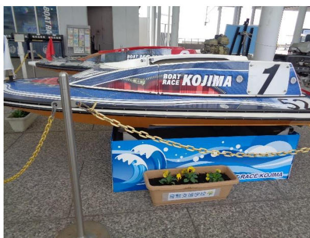
【ボートレース児島】