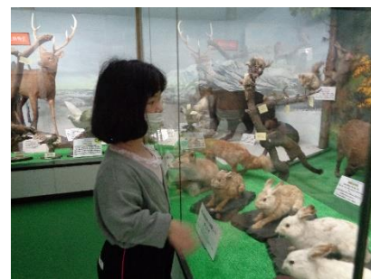
↑「つやま自然のふしぎ館」